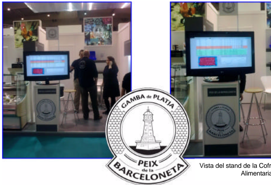
Vista del stand de la Cofradía de Barcelona en Alimentaria 2010

La Cofradía de Pescadores de Barcelona, en el marco de su proyecto de promoción de sus productos, presenta en el salón Alimentaria 2010, el sistema de subasta remota de Autece