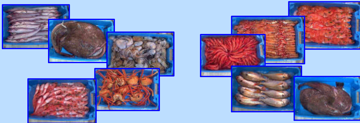
Muestras de las imágenes que se ofrecen a los compradores remotos para facilitar la selección del pescado a comprar

Un grupo de lonjas son pioneras en la implantación del sistema de subasta remota de Autece. Concretamente las lonjas de las Cofradías de Pescadores de : Port de la Selva, Santa Pola, L'Ametlla de Mar, Vilanova i la Geltrú i Barcelona están actualmente en periodo de pruebas.