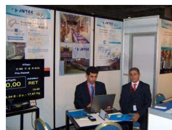
La nostra delegaci3 comercial a la fira

AUTEC va ser present al sal3, exposant els seus productes per al sector pesquer i agr3cola, sistemes de venda electr3nica, sistemes de preparaci3 de comandes, traabilitat, pesatge i etiquetatge.