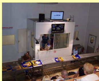
Vista de la venda