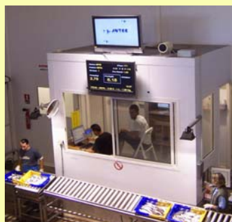
Vista de la venda

S'ha instal·lat tamb3 el sistema informtic per a la gesti3 administrativa de les vendes.