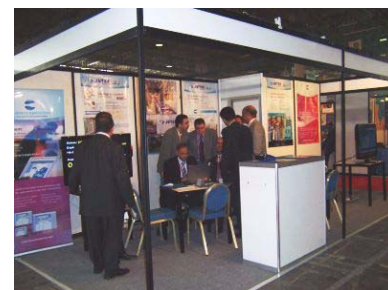
Visites al nostre stand