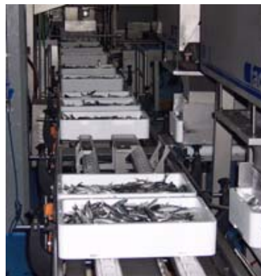
Pesage, étiquetage, lecture code à barres

Le projet a été co-financé avec des fonds de l'IFOP, de la Generalitat de Catalunya et du MAPA - Ministère de l'Agriculture, de la Pêche et de l'Alimentation.