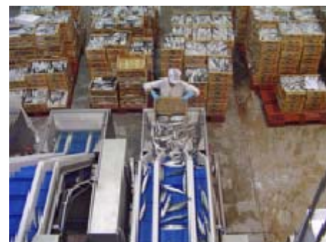
Tri et classification