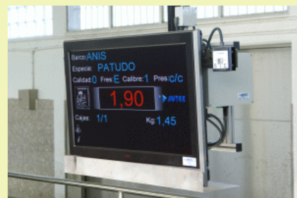
Panneau de vente