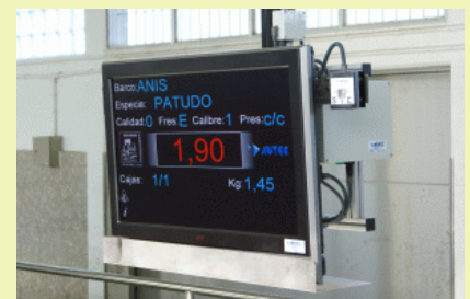
Panell de la subhasta