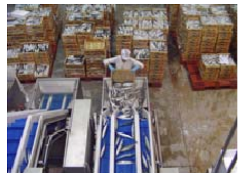
Procés de classificació