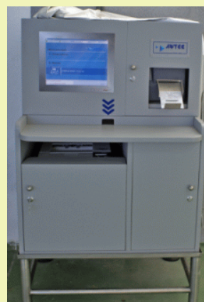
Nou equip multifunció

- Pel que fa al sistema de gestió, s'ha canviat la base de dades que s'utilitzava fins ara per una altra molt més actualitzada i potent.