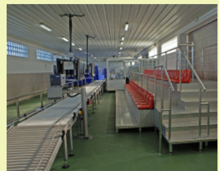
Vista General de la Instal·lació